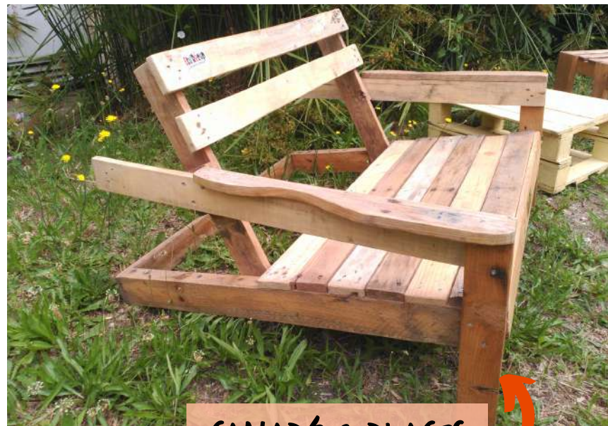
CANAPÉ 2 PLACES