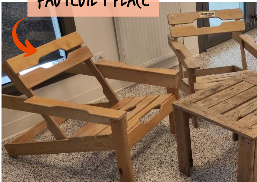
FAUTEUIL 1 PLACE

Nous pouvons adapter la location selon vos besoins !