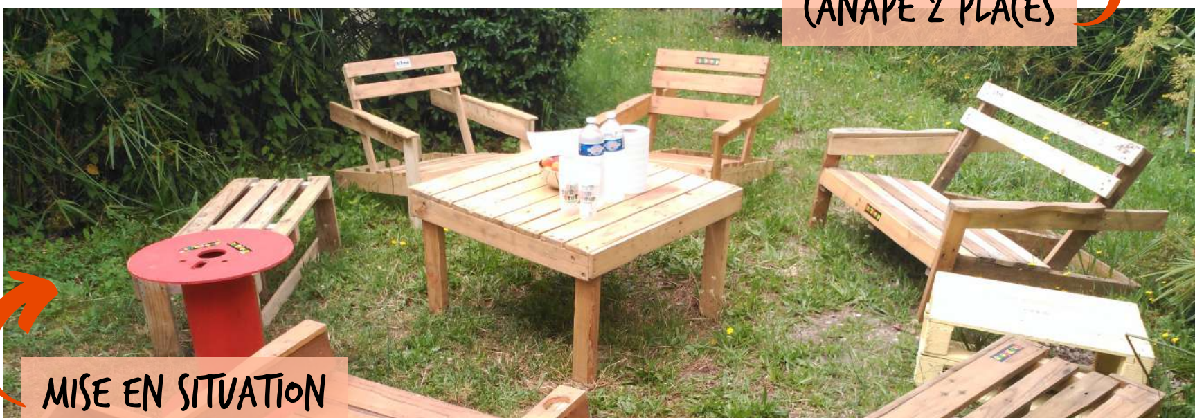
MISE EN SITUATION

Nous louons également un COMPTOIR (3,5 mètres de long) au tarif de 30€ , parfait pour vos soirées festives !